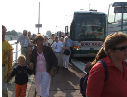
Uitstappen in Alkmaar