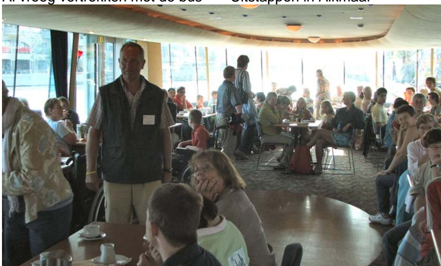
Aan boord worden we getrakteerd op koffie met gebak