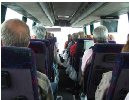
Al vroeg vertrokken met de bus