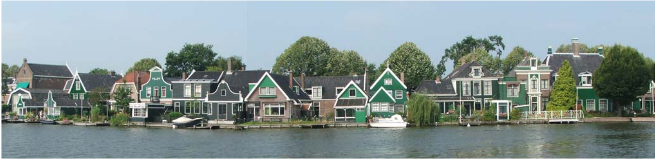
De Zaanse Schans